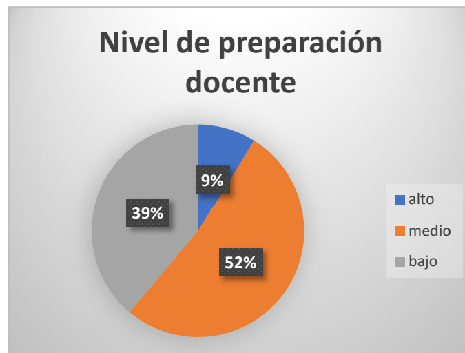
Figura 2. Niveles de preparación docente de la UEP “La Providencia”

Como se puede apreciar en la figura 2 basada en los datos de la tabla 1, los maestros de dicha institución tienen un nivel promedio frente a estas NEE, las mismas que son tratadas de acuerdo al grado de discapacidad que posee cada estudiante en el informe entregado por el personal del Departamento de Consejería estudiantil (DECE), en donde se adjunta las diferentes actividades que se deben practicar y realizar con dichos educandos. El desafío de esta educación inclusiva se da en la puesta en marcha de las recomendaciones para trabajar con los estudiantes de NEE, ya que el docente tiene que abarcar estas recomendaciones insertándolas en las actividades regulares.